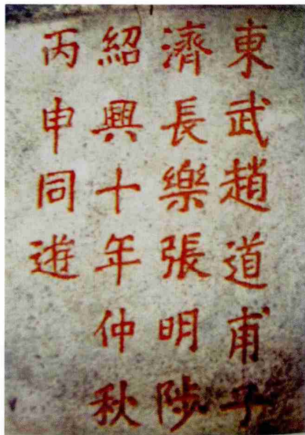
图一 泉州九日山南宋赵道甫纪游石刻